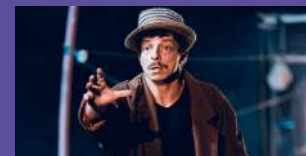
TOUSËL - CIE ZOIPOK

Repérés par les quatre salles de l'Ouest, les spectacles intégrés au dispositif Békali bénéficient de résidences, de coproductions, de diffusions concertées, d'actions de sensibilisation des publics et de décentralisations.