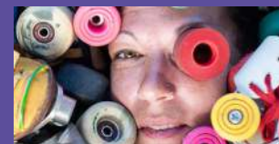
KOM SUR DES ROULETTES - CIE DES LIANES