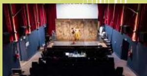
2 SALLES DE SPECTACLES

La salle « Alain Peters » située à l'étage est principalement dédiée au spectacle vivant et compte 160 places.