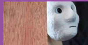
TRYPTIQUE DE STÉRÉOTYPES

Repérés par les quatre salles de l'Ouest, les spectacles intégrés au dispositif Békali bénéficient de résidences, de coproductions, de diffusions concertées, d'actions de sensibilisation des publics et de décentralisations.