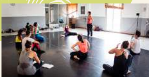
SALLE DE DANSE

La salle de projection « Jacques Lounon » située au RDC offre une jauge de 140 places.