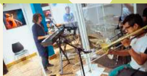
2 STUDIOS DE RÉPÉTITION

De 166 m2, la salle « Blanche Pierson » est équipée d'un mur de miroirs ainsi que d'une sonorisation complète. Disponible à la location du mardi au samedi.