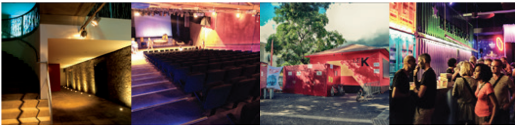
Léspas Culturel Leconte de Lisle | Saint-Paul